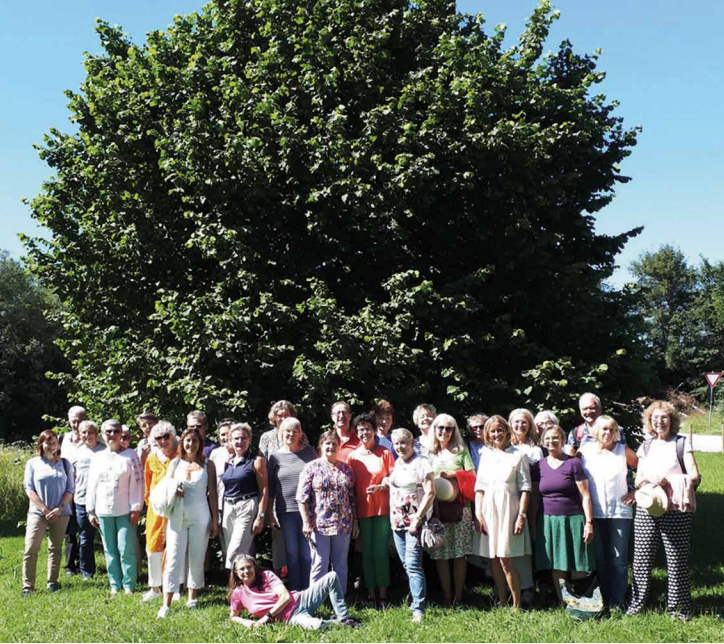
Ausflug nach Benediktbeuern.